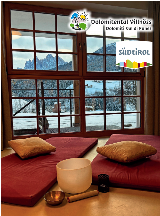
Auszeit mit Yoga / Time Out con Yoga